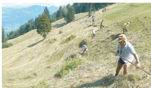
Aktion Heugabel Frastanz Bazona