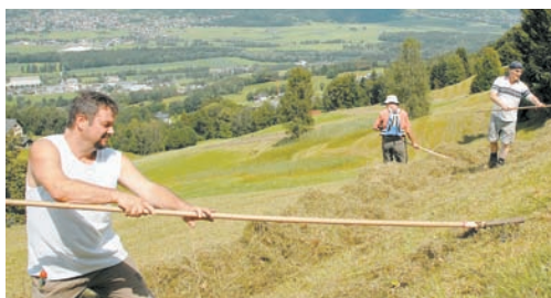
Profis am Werk