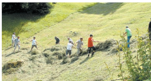
Die Bürgermeister heuen gemeinsam

Da ist natürlich jede zusätzliche Arbeitskraft ein Gewinn. Denn sie verkürzt die Arbeitszeit und gibt neue Kontakt- und Gesprächsmöglichkeiten. Und ist eine Person mehr, die um die Zusammenhänge in der Natur mehr weiß und das nicht leichte Wirken der Bauern für die Erhaltung unserer Landschaft schätzt. Gerade für die Menschen an den Bürotischen ist dieser Einsatz ein wunderbarer Ausgleich, der keinerlei Vorkenntnisse voraussetzt. Schon 2 Einsätze ergeben die Mountainbikechance. Rufen Sie einen der Bauern an. Sie werden es nicht bereuen!