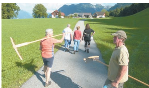
Nach getaner Arbeit