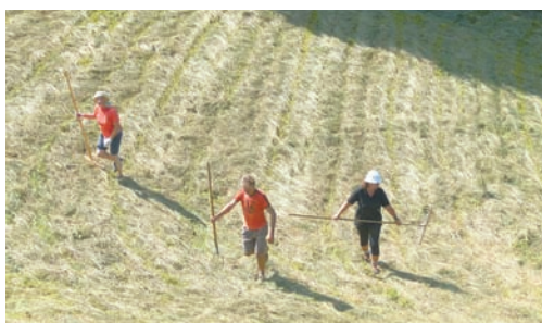
Heueinsatz in steilster Lage in Nenzing