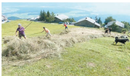
Heueinsatz am Schnifnerberg