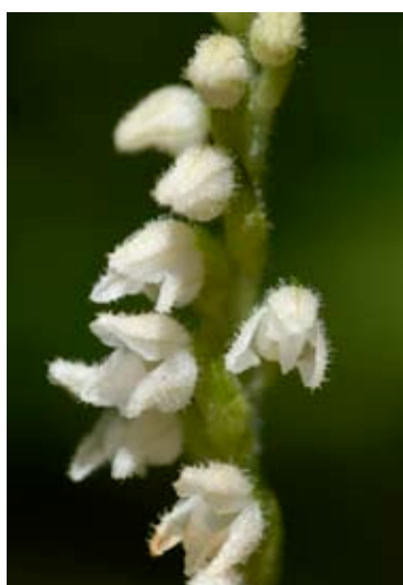
Kriech-Netzblatt (Mooswurz, Spaltwurz, Moosorchis, Kriechstängel)