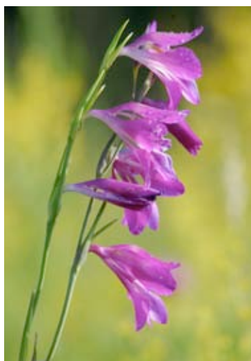
Sumpf-Gladiole, S. Siegwurz