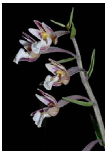
Sumpf-Stängelwurz, Weiße Sumpfwurz